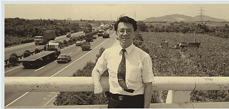
82年6月 92年10月 校長攝於校區南方高架橋上